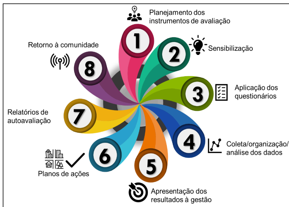
Figura 1 — Etapas da autoavaliação