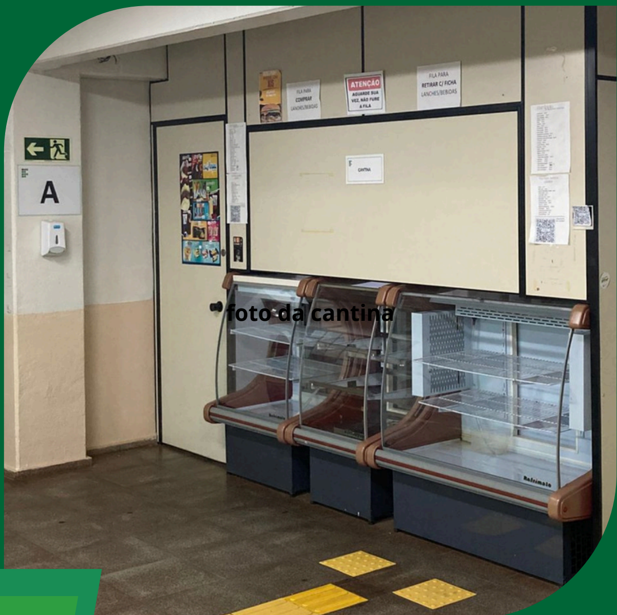
foto da cantina