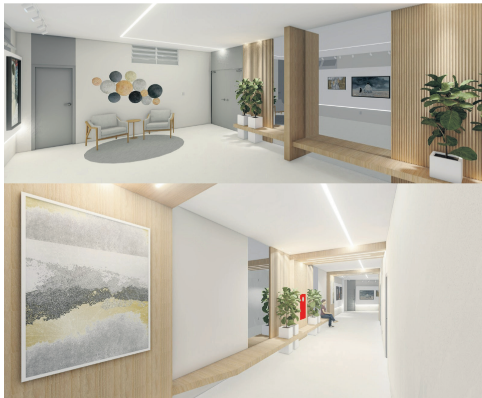
Projeto arquitetônico para o novo andar S2 da Apusm

A obra já está em fase avançada, com a conclusão das estruturas dos banheiros e da copa do salão de festas. A expectativa é que, ao final, o espaço se torne um ponto de encontro dinâmico e multifuncional para os associados da Apusm, suprimindo as necessidades de lazer, trabalho e bem-estar.