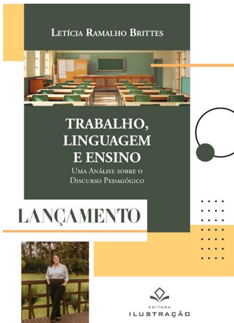
Layout da capa do livro publicado e material de divulgação da editora

https://www.livro.vc/livros/educacao/educacao-e-desenvolvimento/trabalho-linguagem-e-ensino