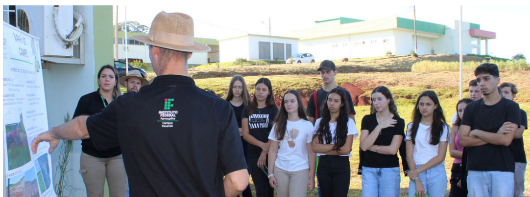
Manhã de Campo, realizada pelos cursos do Eixo de Recursos Naturais (20/03)