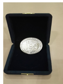
Medalha dos 185 anos do Colégio Pedro II concedida aos participantes do IFFAR