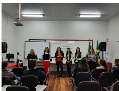
Estudantes da turma 5