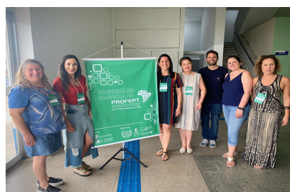
Participantes do Polo do IFFar