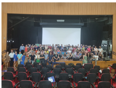
Foto coletiva dos participantes do evento

A seguir alguns registros fotográficos realizados durante o evento no Colégio Pedro II.