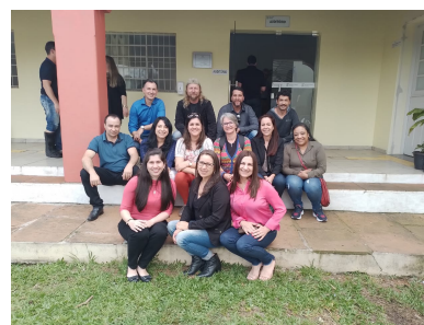
Estudantes da turma 4