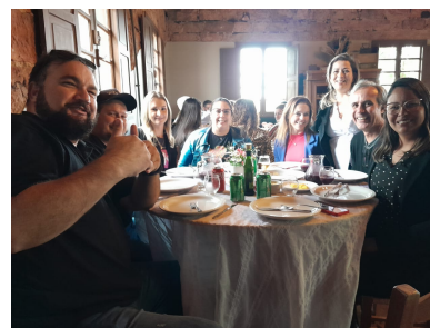
Almoço de confraternização